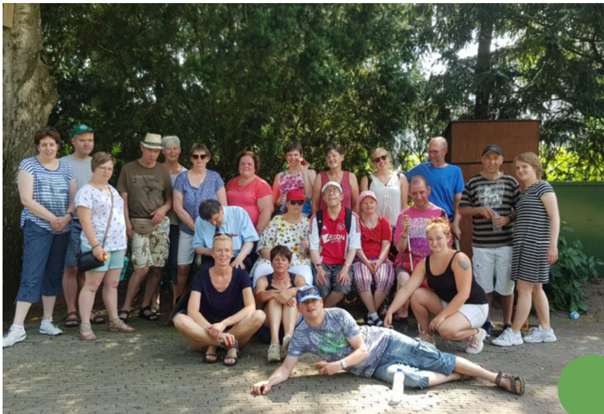
Villa Ramon – De Efteling