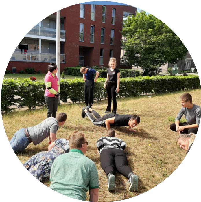
De Spanners zijn sportief

Eén van de buurjongens van het Span studeert aan de opleiding voor Sport en Beweging aan de Hogeschool Arnhem en Nijmegen. Hij had gevraagd of de Spanners het leuk zouden vinden om samen met hem een sportactiviteit te doen.