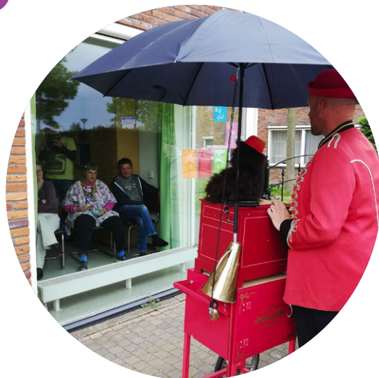
In actie bij Villa Ramon

Met z'n allen zitten we in een rare en bizarre tijd we mogen niet meer werken niet meer naar ouders of familie. Verjaardagen worden op een vreemde manier gevierd we mogen geen handen meer schudden voor kennismaking of als er iemand jarig is. Eens in de zoveel weken of wat eerder kijken we met z'n allen naar de persconferentie waar in de premier rutte verteld. Waar we met allen rekening mee moeten houden en waar we met z'n allen aan moeten denken. Binnen zorgwiel gelden er nu strikte voorwaarden. Ouders mogen niet tegelijk (met z'n tweeën) naar binnen ook is belangrijk dat je regelmatig je handen wast ook een keertje extra. Is er 1 iemand die zich niet aan de regels of maatregelen houdt binnen de stichting van zorgwiel dan wordt alles weer teruggedraaid.