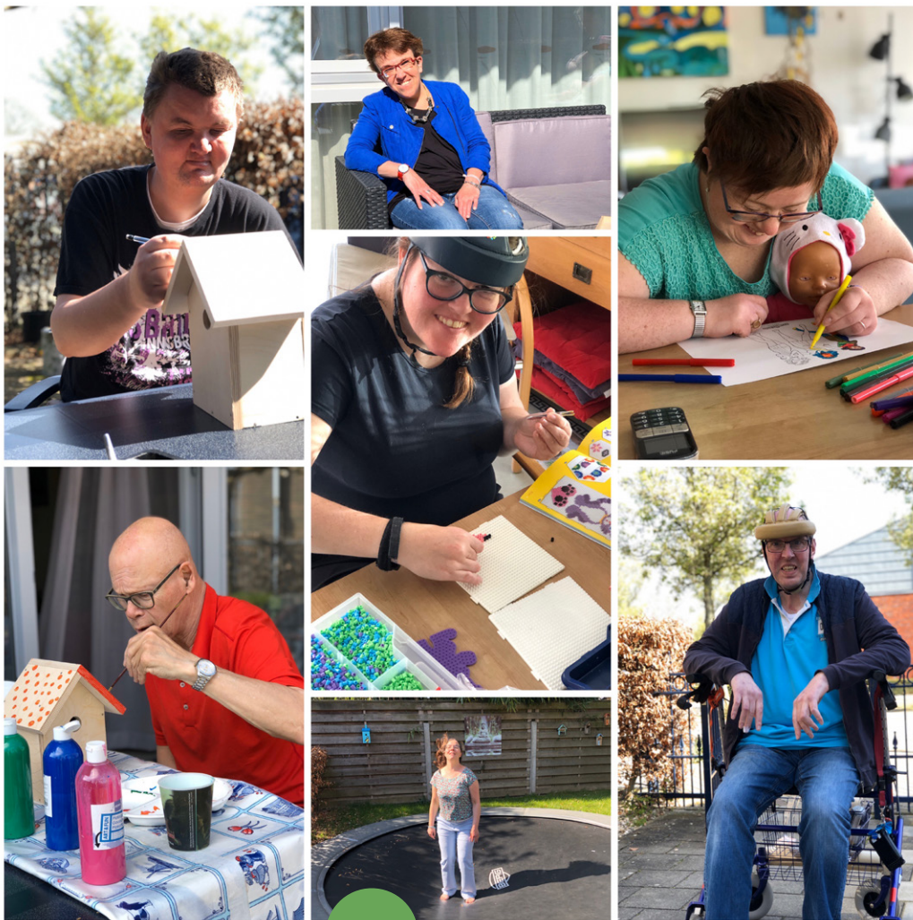
Genieten op de Strang