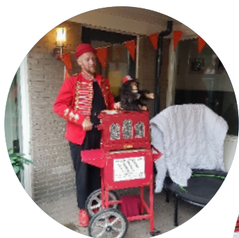
De Orgelman bij de Blitz